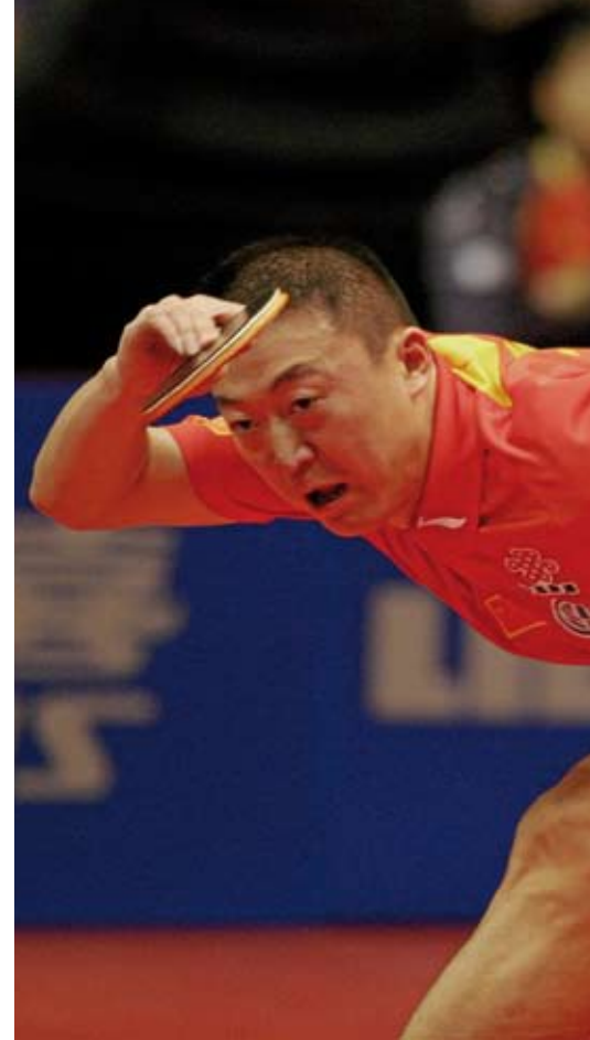
Immer im Gleichgewicht: Ma Lin, China Garde toujours son équilibre: Ma Lin, Chine

Diese ist für den Tischtennissport nur bedingt relevant, um zum Beispiel beim Ein-